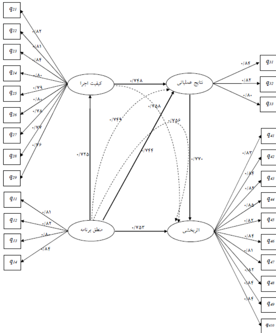
شکل ۲- معادلات ساختاری ابعاد اثربخشی تسهیلات اعطایی طرح بهبود و افزایش تولیدات دامی

همچنین، یافته‌ها نشان داد که مقدار (کای دو/ درجه آزادی) برآورد مدل کمتر از ۳، شاخص خوبی تناسب یا برازش (GFI) و تعدیل شده آن (AGFI) بیش از نود درصد و شاخص