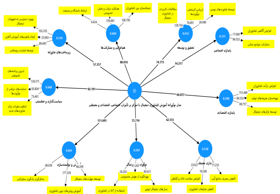
شکل ۲- آماره t مربوط به ضرایب مسیر متغیرهای مدل پژوهش

سیاست‌گذاری و خط‌مشی (۰/۸۱۷) و آموزش و توانمندسازی (۰/۸۱۳) بوده، که بیانگر نقش کلیدی این عوامل در تحقق آموزش مؤثر کشاورزی دیجیتال در مناطق روستایی است. همچنین، مؤلفه‌هایی مانند تحقیق و توسعه (۰/۷۸۲)، هم‌افزایی و مشارکت‌ها (۰/۷۷۷)، نوآوری‌های دیجیتال (۰/۷۷۲) و زیرساخت‌های فناوریانه (۰/۷۶۱) نیز با ضرایب بالا نشان می‌دهند که بدون زیرساخت مناسب و نوآوری مستمر، دستیابی به آموزش کارآمد دیجیتال امکان‌پذیر نخواهد بود. پایداری اقتصادی با ضریب ۰/۷۶۸ نیز نشان می‌دهد که توجه به جنبه‌های اقتصادی برای پایداری این نوع آموزش بسیار مهم است. در مقابل، پایداری اجتماعی با ضریب ۰/۳۶۲ کمترین تأثیر را دارد، اما همچنان معنی‌دار است و بر اهمیت توجه به عوامل اجتماعی در کنار سایر ابعاد تأکید دارد.