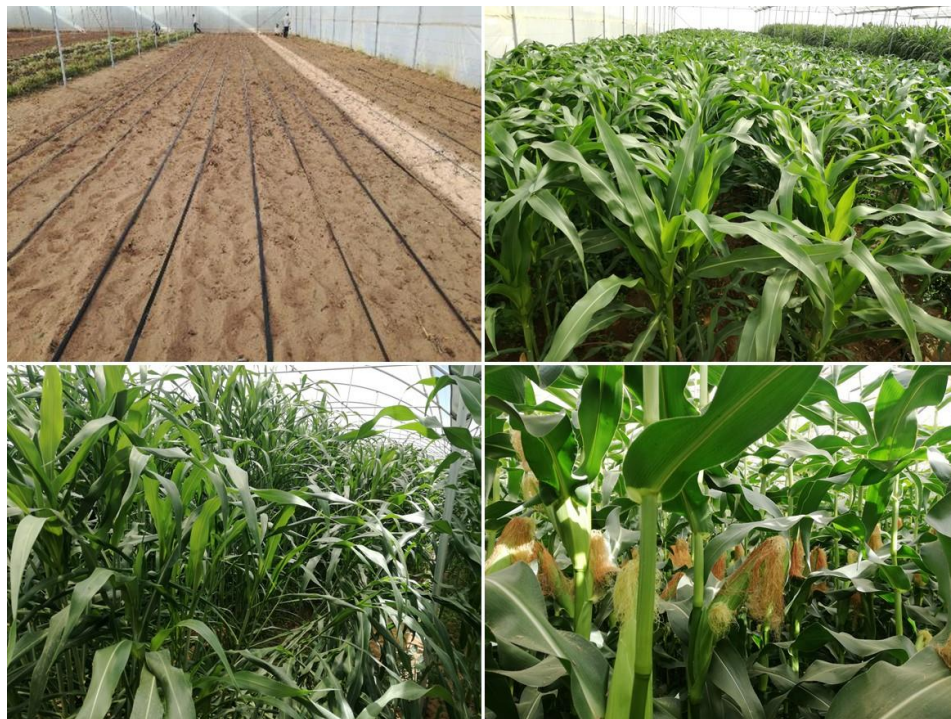
شکل ۱- وضعیت پوشش گیاهی سورگوم و ذرت در گلخانه

سال، ارزیابی اقتصادی، هم از نظر ارزش اقتصادی میزان تولید علوفه در گلخانه و هم در مقایسه با میزان تولید محصولات گلخانه‌ای رایج (یعنی، کشت خیار و گوجه فرنگی)، انجام شده است.